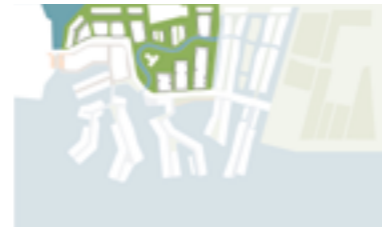
Boomrijke lanen en groene openbare ruimtes.