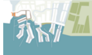
Het water wordt onderdeel van de wijk.

Ook groen wordt naar binnen gebracht door de aanleg van 'nieuw' landschap: boomrijke lanen en kleinschalige maar talrijke openbare ruimtes. Bovenlangs stroomt het Slochterdiep dat De Zeilen verbindt met het bestaande noordelijk gelegen landschap. Al deze waterrijke en groene elementen geven De Zeilen de ruimte voor spelen, vaarrecreatie en beschutting.